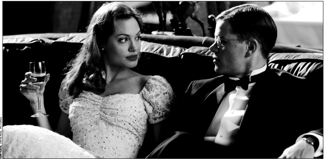
► Angelina Jolie es la esposa de Matt Damon, quien encarna a un jefe de la agencia de inteligencia de los Estados Unidos.

Otra de las figuras que trabaja en la película y que no rechazó la oferta y aceptó el desafío de